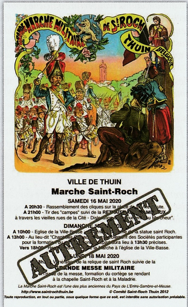
Affichette annuelle modifiée

mencent, des avis sont recueillis, des propositions testées... Certes, il n'y aura pas de Marche au sens strict d'une procession escortée puisque les rassemblements sont interdits, mais il y aura une autre Saint-Roch !